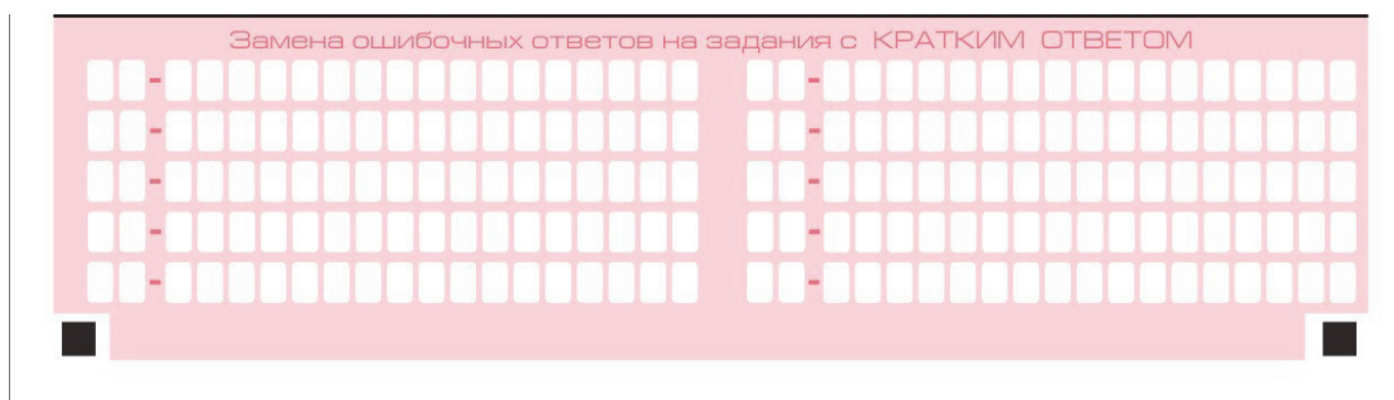
Рис. 8. Область замены ошибочных ответов на задания с кратким ответом

В нижней части бланка ответов № 1 предусмотрены поля для записи исправленных ответов на задания с кратким ответом взамен ошибочно записанных (рис. 8).