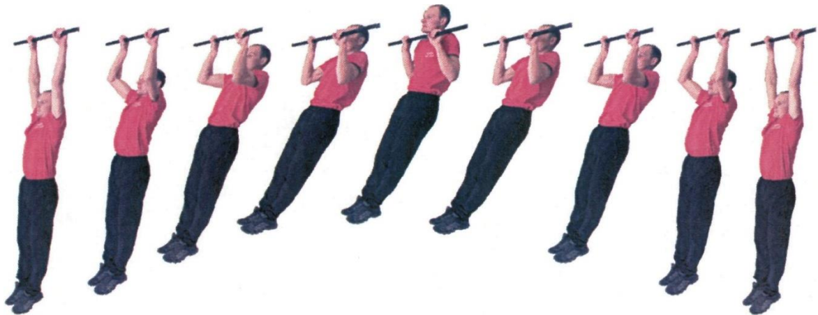
Рис. 3. Подтягивание на перекладине

При нарушении условий выполнения упражнения, повторение не засчитывается, подается команда "НЕ СЧИТАТЬ".