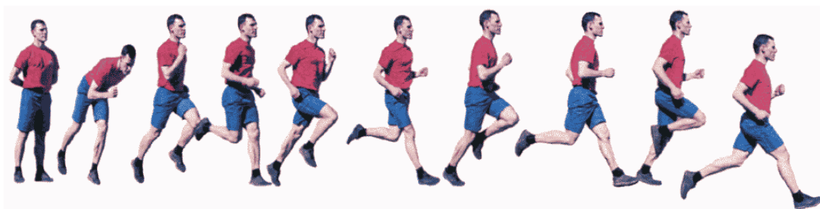
Рис. 22. Бег на 1 км, бег на 3 км, бег на 5 км.

Старт и финиш, как правило, оборудуются в одном месте. При выполнении упражнений на беговой дорожке стадиона старт и финиш производится в соответствии с разметкой стадиона.