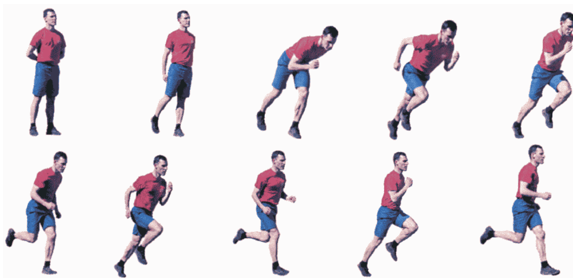
Рис. 17. Бег на 60 м, бег на 100 м