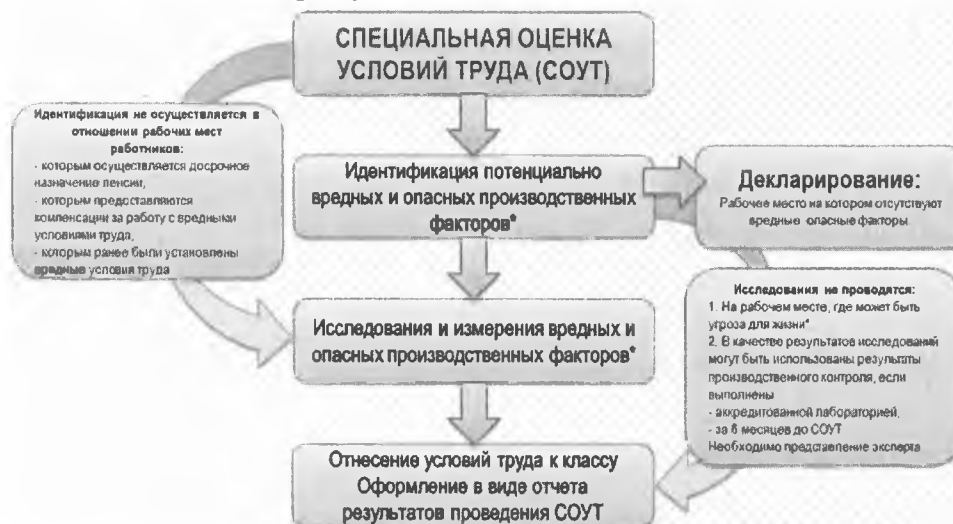
Рисунок 1 – Мероприятия по специальной оценке условий труда

5.3 Специальная оценка условий труда является единым комплексом последовательно осуществляемых мероприятий по идентификации вредных факторов производственной среды и трудового процесса, а также оценке уровня их воздействия на работника с учетом отклонения их фактических значений от установленных нормативов (гигиенических нормативов) условий труда и применения средств индивидуальной и коллективной защиты работников, представленных на рисунке 1.