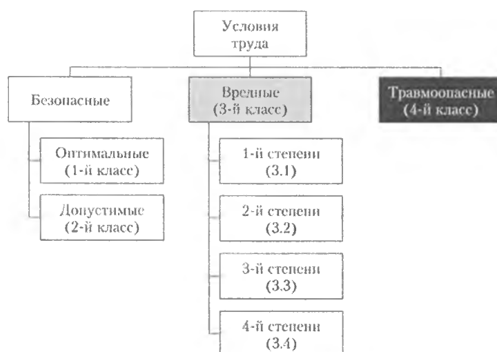
Рисунок 4 - Классификация условий труда

подкласс 3.4 – вредные условия труда 4-й степени. К нему относят условия труда, при которых на сотрудника воздействуют вредные или опасные производственные факторы, уровни воздействия которых способны привести к появлению и развитию тяжелых форм профзаболеваний (с потерей общей трудоспособности) в период трудовой деятельности.