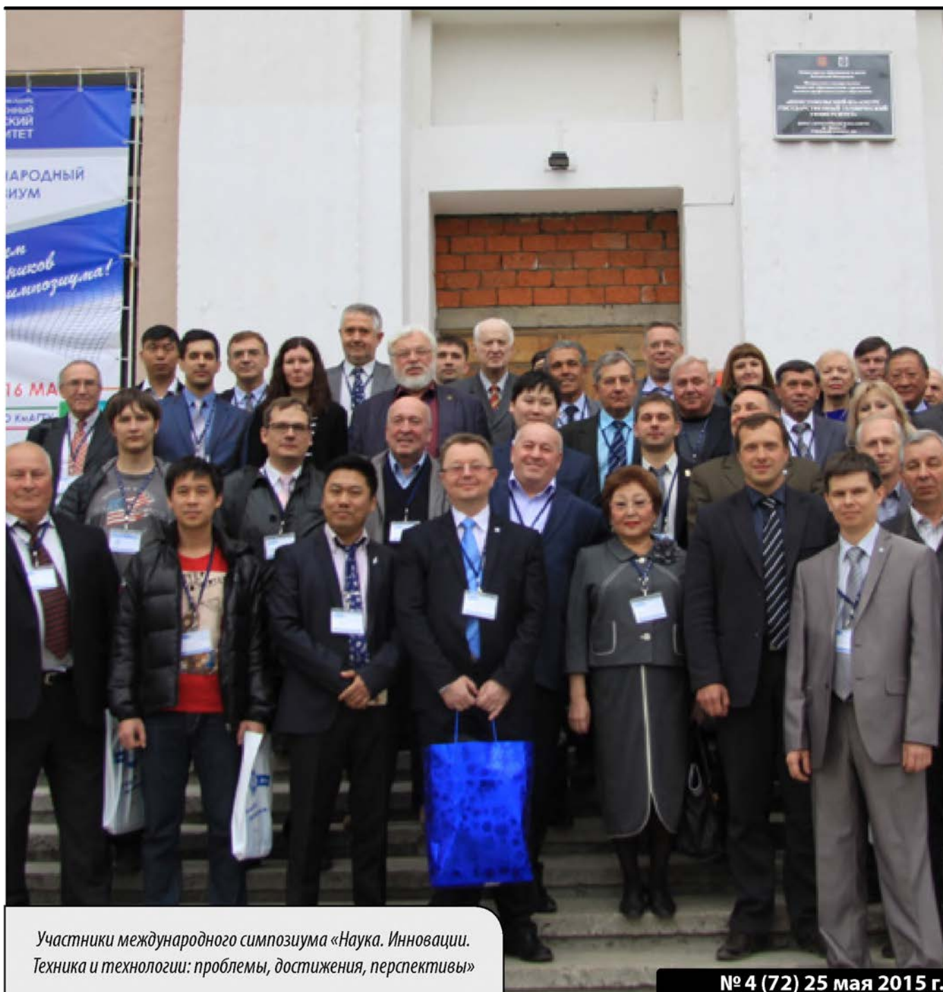
Участники международного симпозиума «Наука. Инновации. Техника и технологии: проблемы, достижения, перспективы»