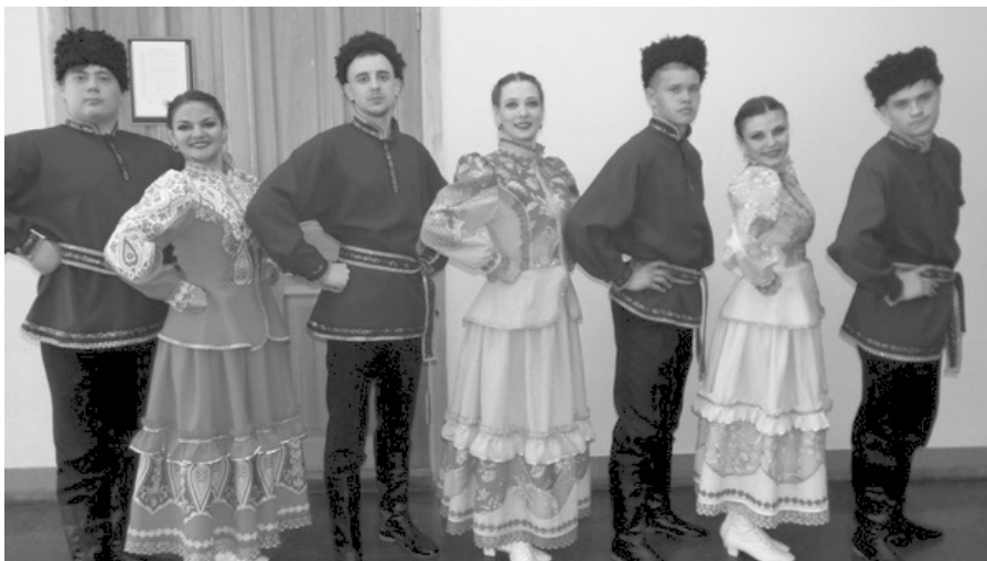
Вокальная студия «Вояж»

Вокальный коллектив студентов «Вояж» стал победителем в номинации «Специальный приз жюри». Руководители вокальных коллективов В.А.