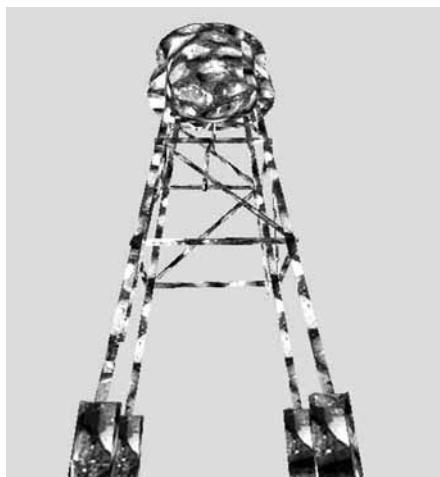
Рис. 1 — Отображение на нашем движке, статичной модели водонапорной башни