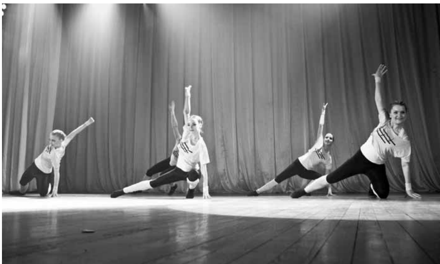
Выступление коллектива «Контраст»