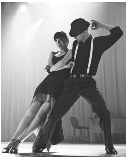
Выступление коллектива «El'Grand»

Студенты нашего вуза ежегодно принимают участие в различных конкурсах фестиваля и уже неоднократно завоёвывали призовые места. В прошлом номере нашей газеты мы писали про победы наших студентов в научных секциях. В этом выпуске мы расскажем о том, как проходили творческие этапы «Студенческой весны». В текущем году их было четыре: «Театральное искусство», «Хореографическое искусство», «Вокальное искусство» и «Журналистика». КНАГТУ не принял участие только в театральном конкурсе.