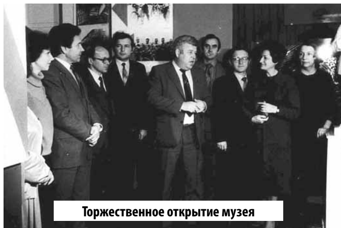
Торжественное открытие музея