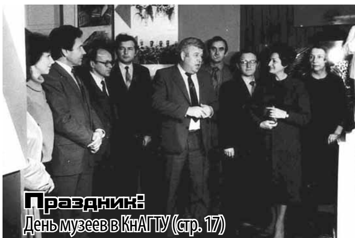
Праздник: День музеев в КНАГТУ (стр. 17)