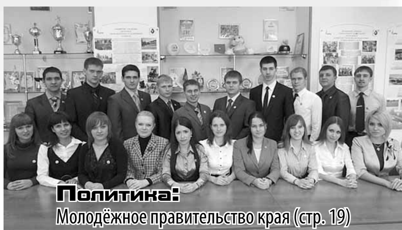
Политика: Молодёжное правительство края (стр. 19)