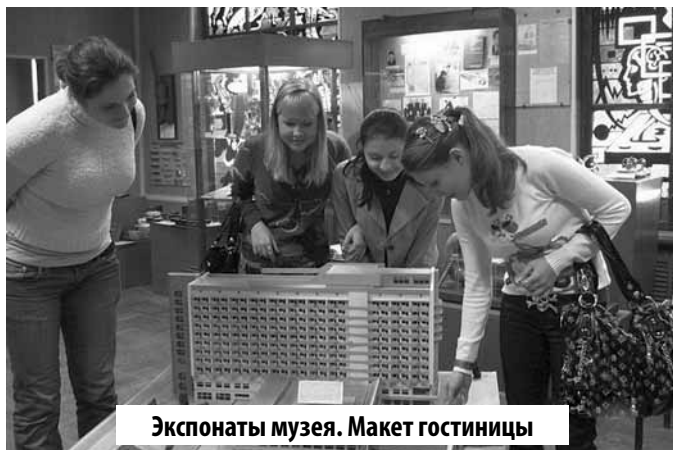
Экспонаты музея. Макет гостиницы