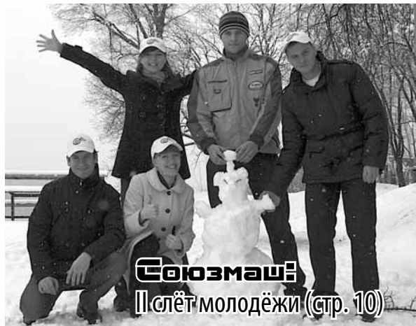
Союзмаш: Плёт молодёжи (стр. 10)