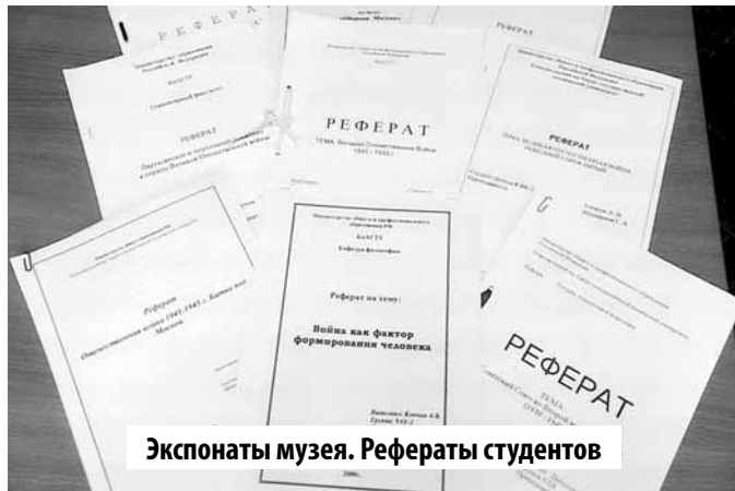
Экспонаты музея. Рефераты студентов