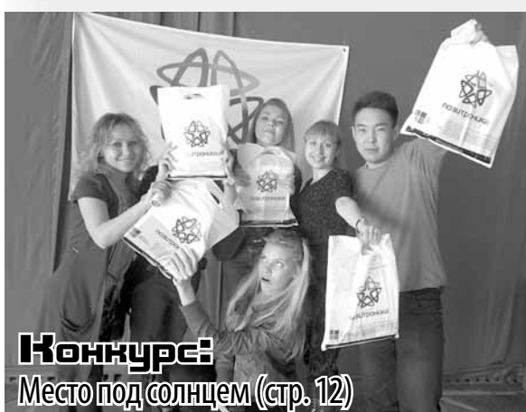
Конкурс: Место под солнцем (стр. 12)