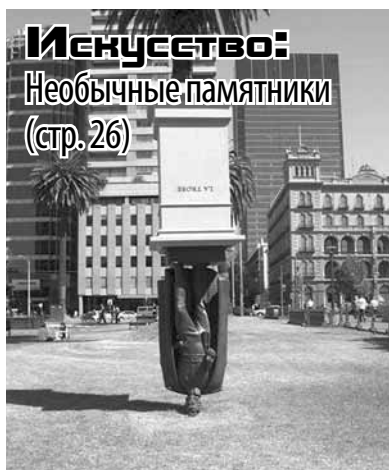
Искусство: Необычные памятники (стр. 26)