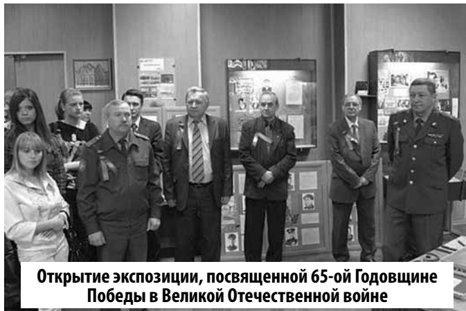
Открытие экспозиции, посвященной 65-ой Годовщине Победы в Великой Отечественной войне