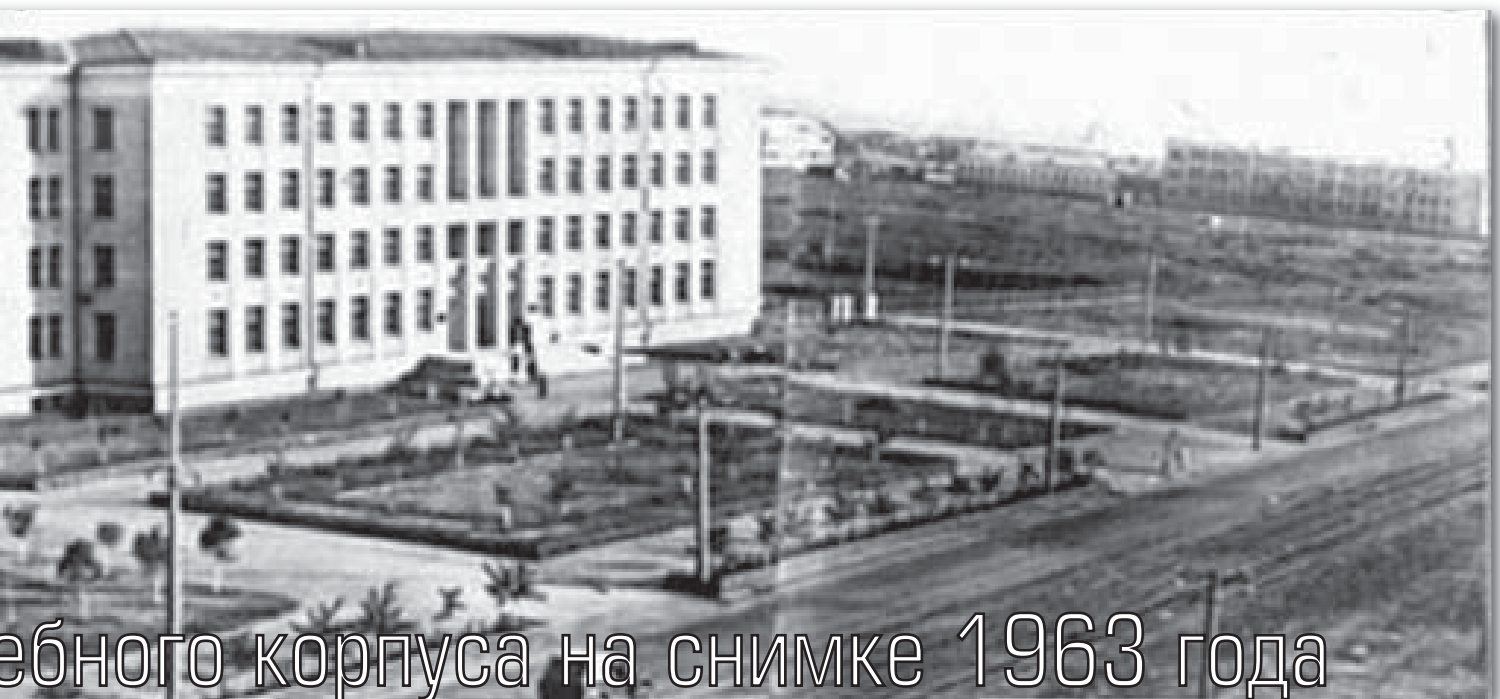
Забного корпуса на снимке 1963 года