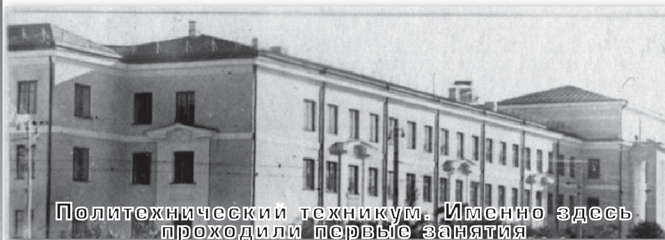
Политехнический техникум. Именно здесь проходили первые занятия

на-Амуре был открыт вечерний политехнический институт.