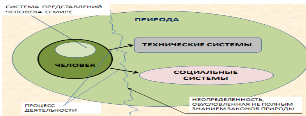
Рис. 1. Преобразование природной среды в техносферу: структурирование среды и формирование БСТС

текст текст текст текст текст текст текст текст текст текст текст текст текст текст текст текст