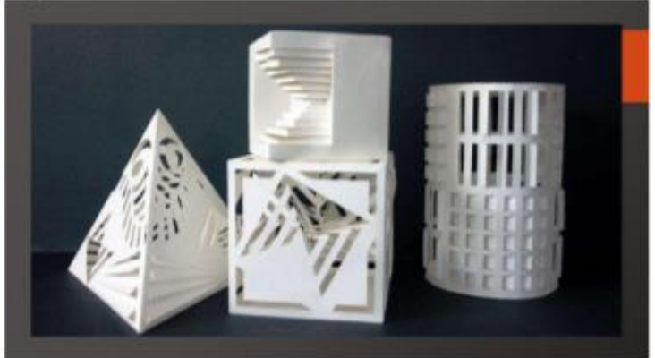
Рис. 1 – примеры объемно-пространственной композиции: а) Пластика, б) Ритм, в) Динамика, г) Тектоника