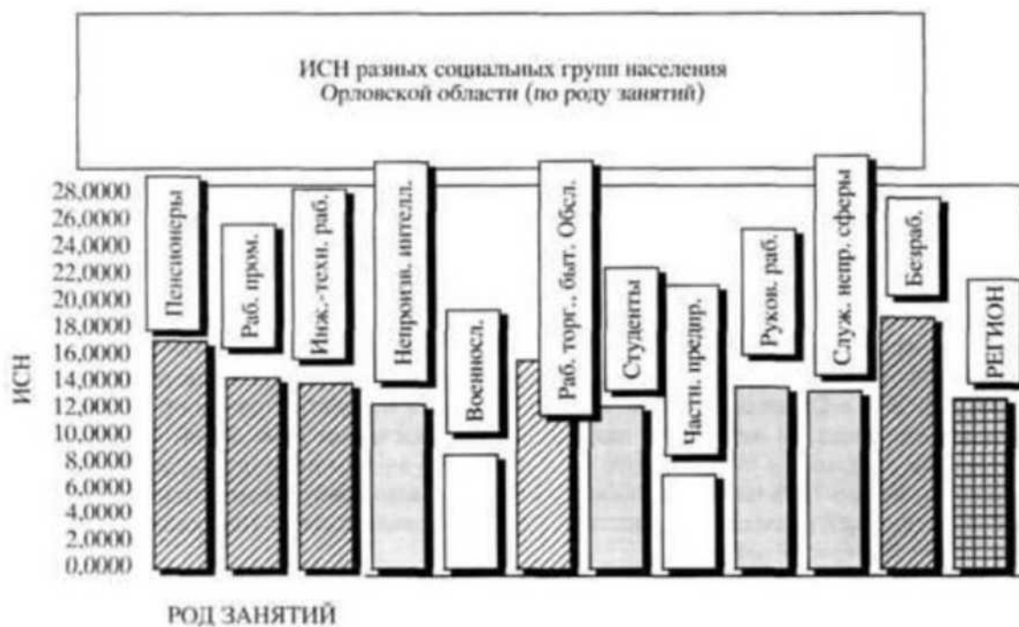
Рисунок - Индекс социальной напряженности среди различных социальных групп населения