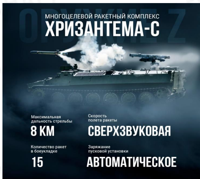
фото - из официальных источников)

Один из ярких представителей артиллерийского букета – «Хризантема-С». Три такие грозные машины с романтическим именем могут противостоять целой роте танков противника.