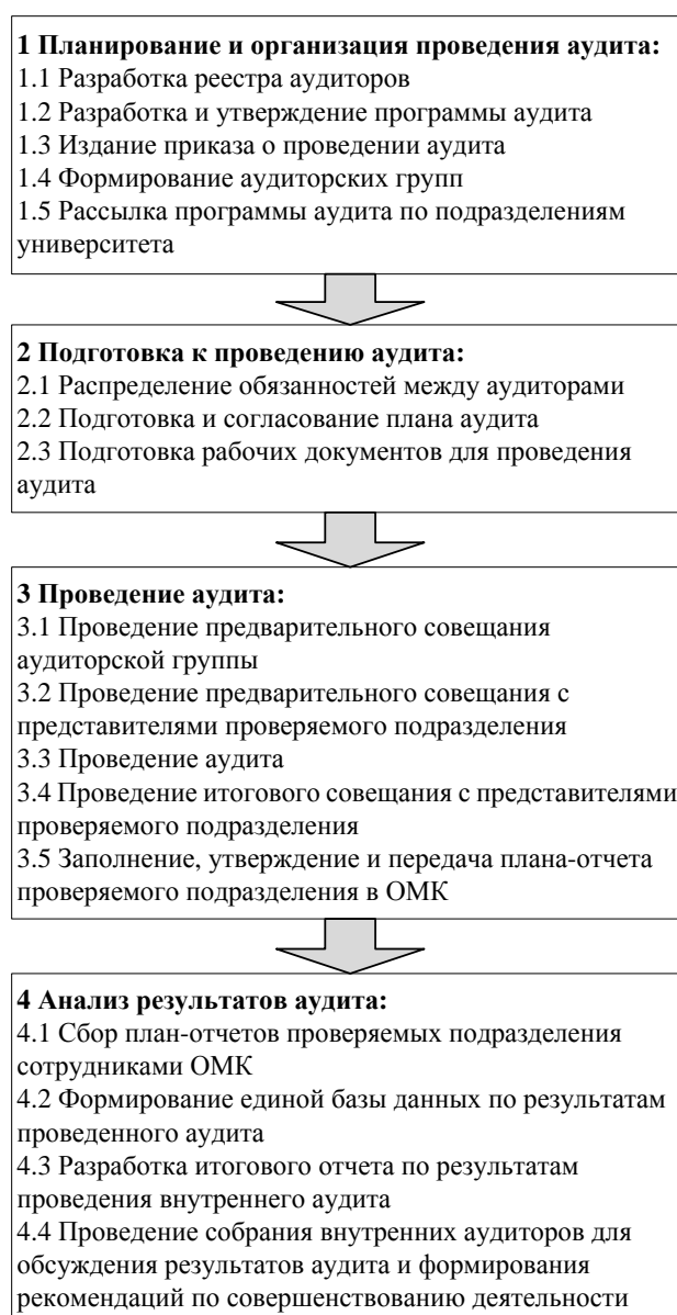
Рисунок 1 – Схема проведения внутреннего аудита

Форма программы аудита публикуется на сайте университета: www.knastu.ru / Университет / Подразделения / Отдел менеджмента качества / Аудит.