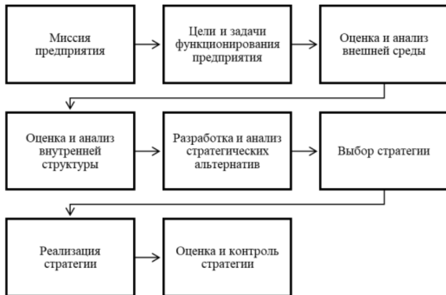
Рисунок 1 – Стратегическое планирование

Составлена поэтапная организация стратегического планирования на предприятии.