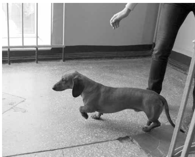
Это та самая такса

Как бедное животное попало в университет, и что с ним стало после того, как его выгнали, нашим корреспондентам узнать так и не удалось. Остаётся лишь надеяться, что у таксы всё сложилось хорошо.