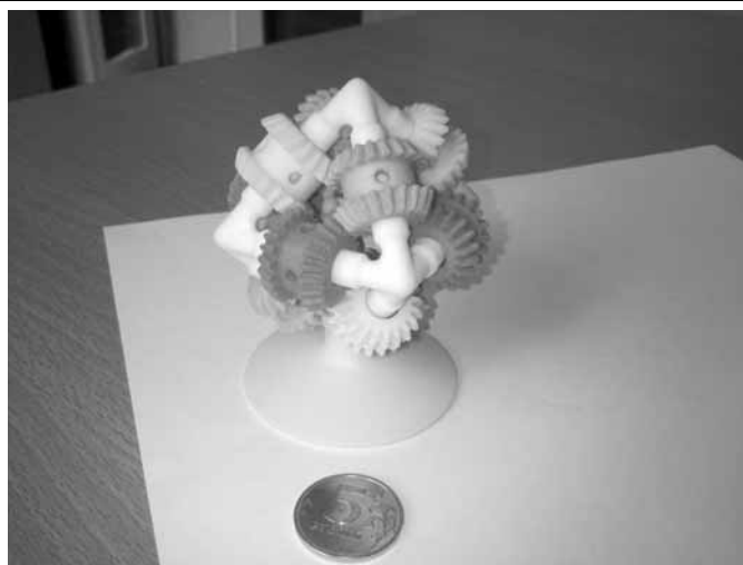
Узел в сборе, изготовленный на 3D принтере