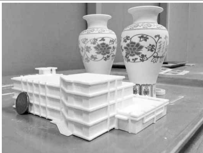
Первые пробные образцы распечатанные на 3D принтере