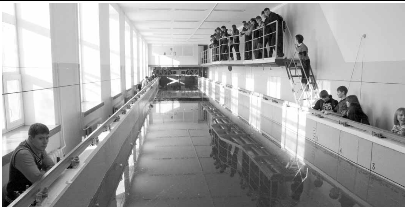
Опытный бассейн КНАГТУ

даря выигранному гранту мы смогли объединить наши усилия.