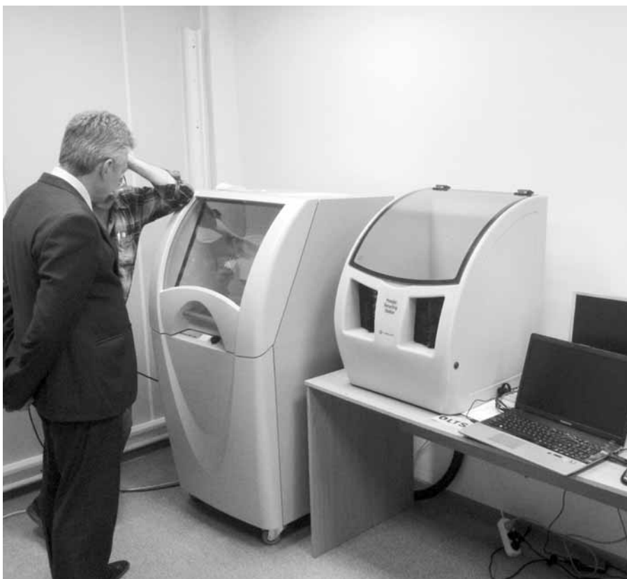
Общий вид оборудования для печати

В случае необходимости изготовления прототипа сложной детали из стали, алюминия, пластмассы и т. п., трудоемкость и материалоемкость данной операции достаточно высока, да и сроки изготовления могут растянуться на месяцы. С использованием 3D принтеров сроки и стоимость изготовления сокращаются в разы, нужна только хорошая 3D модель и через 3-8 часов можно апробировать прототип на собираемость, эргономичность, соответствие предъявляемым тре-